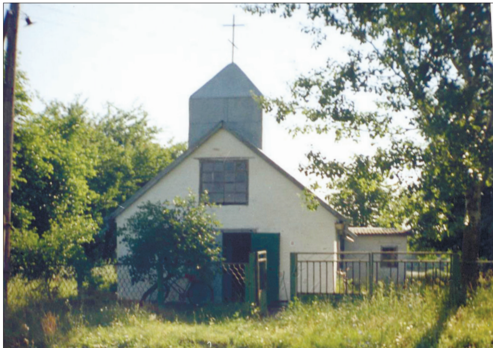
Покровська церква с. Білоцерківки.

Наша Білоцерківка – прекрасне село. Було воно, мабуть, не менш красивим і в глибоку давнину, у часи, коли стало козацькою слобідкою (II чверть XVII століття), і сотенним містечком із 1797 року, і районним центром у 1923 році.