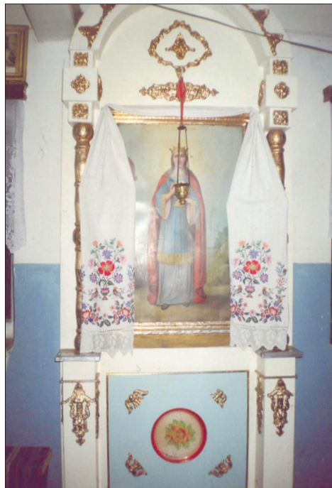
Найдавніші ікони – дорогі реліквії Покровської церкви.

При церкві було 33 десятини землі (присадибна, сінокіс, ліс). Її пожертвували в різний час різні люди. У приході Архангело-Михайлівської церкви значаться хутори Зубівщина, Бондаревщина, Красногорівка, Пустовітові,