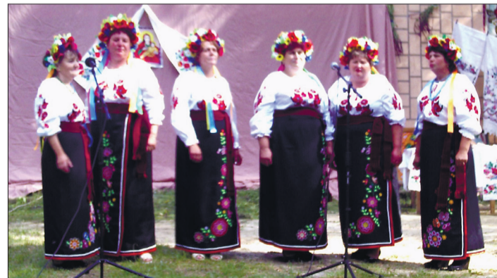
Святкування Дня села в Бірках – із концертом, виступами художніх колективів – запам'яталося надовго.