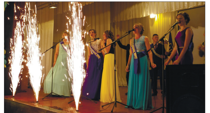
У добру путь, випускники! Випускний вечір у Білоцерківській ЗОШ.

У Красногорівці відновлено роботу сільського Будинку культури. Аматорський колектив народних музик «Красногорівські витівники» є постійними лауреатами обласних та всеукраїнських фестивалів народної творчості. А новостворений фольклорний ансамбль «Горлиця» вже став улюбленцем не лише жителів