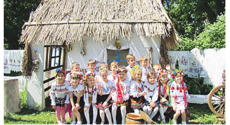
Красногорівські першокласники під час поїздки в Балаклію.