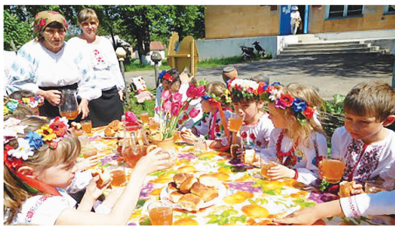
Таких смачних пиріжків, як на святі, здається, ми ніколи не їли!

душі причарували хата з лелечим гніздом та лелекою, криниця та гуси неподалік. Увесь двір був прикрашений вишитими рушниками. На траві лежало та вибілювалося полотно. А лави з майстерно відтвореними килимами, тин, на якому висіли гор-