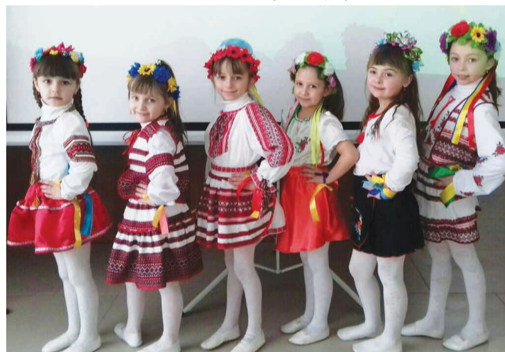
Дитячий танцювальний колектив «Капітошка» Білоцерківського СБК.