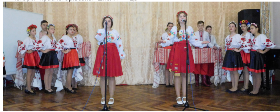
Школа багата талантами.

Хай доля пошле вам довгого віку, Радості, щастя, достатку без ліку. Нехай обминають незгоди і грози, І тільки від сміху з'являються сльози.