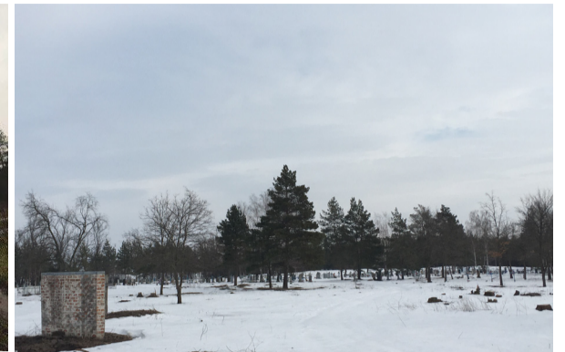
Та ж місцина після виконання робіт.

— Ми запропонували тимчасово попрацювати багатьом членам нашої громади. Відгукнулися безробітні, пенсіонери і навіть ті, хто має роботу, зголосилися підробити на час відпустки. Звичайно, це важка фізична праця, але умови роботи вигідніші. А ТОВ «Білагро» ще