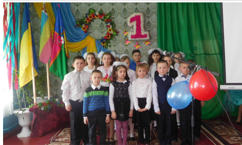
Виступ учнів початкових класів.