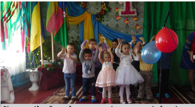
Вітання від наймолодших артистів – вихованців дошкільного підрозділу.