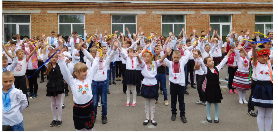
Наші діти – майбутнє громади.

сільської ради забезпечує повноцінний фізичний, інтелектуальний, духовний та творчий розвиток кожної дитини. Пріоритетними напрямками роботи школи є: