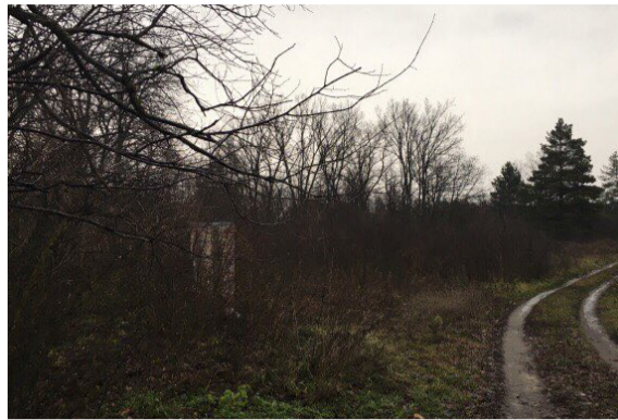
Кутівське кладовище в Білоцерківці до початку благоустрою. Такими були практично всі місця поховань.

комунальники своїми силами, звичайно ж, не впоралися б. На допомогу громаді прийшли ПП «БІАГР» і ТОВ «Білагро». Вони виділили техніку, працівників, а також кошти, щоб залучити людей на оплачувані тимчасові роботи. До речі, ініціатива впорядкувати кладовища на території громади належить де-