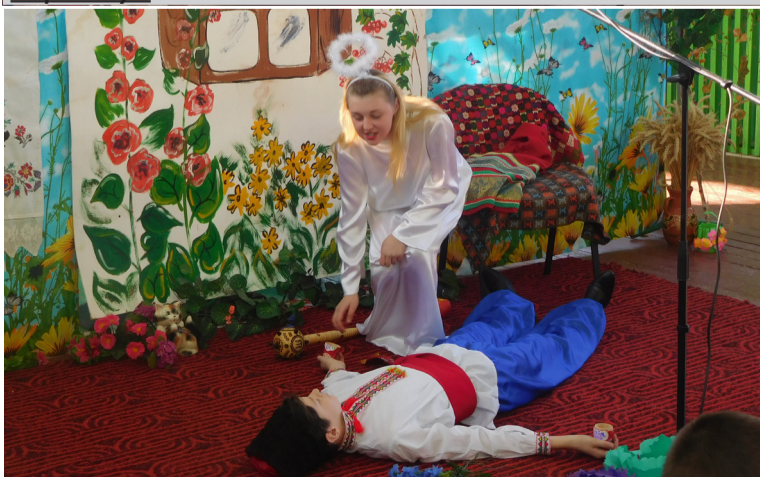
Вистава театрального гуртка «Візит».

Певно, за інших обставин Балаклієвську школу обов'язково б закрили, адже нераціонально утримувати заклад, де навчається півсотні учнів і працює 11 вчителів: опалювати двоповерхове приміщення, виплачувати заробітну плату, забезпечувати підвезення школярів тощо. Проте створення Білоцерківської ОТГ дало друге життя школі: приміщення капітально відремонтували, а сам заклад реорганізували в навчально-виховний комплекс, відкривши відділення для дошкільнят.