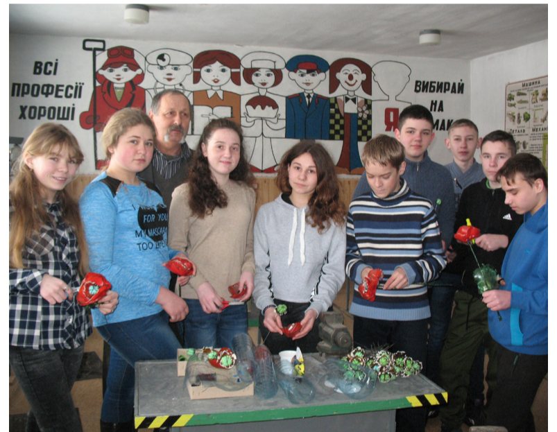
Восьмикласники Красногорівської школи за роботою.

Як бачите, щоб виготовити кожен квітку мака, потрібно докладати чимало зусиль. Однак учні ро-