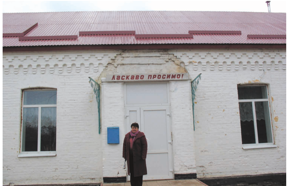
Відремонтований дах Красногорівської школи.

– Ми не забираємо в амбулаторії жодного квадратного метра площі. Але частина приміщення тривалий час не використовувалася. Саме там і плануємо створити сучас-