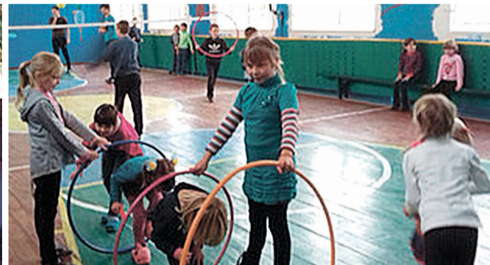
Ось так активно, в рухливих іграх, учні проводять перерви.