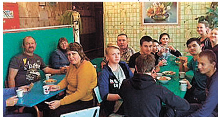
Учителі й старшокласники: разом на заняттях, разом після уроків.

чай і смаколики – це те, що потрібно для формування довіри, взаємоповаги та розуміння. Спільне дозвілля зближує вчителів та дітей, створює позитивний настрій.