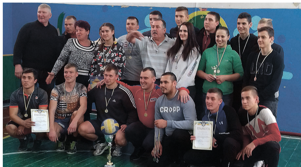
Фото на згадку: учасники команд після змагань.

1 грудня в Бірківському НВК відбулася першість громади з волейболу. Змагалися 4 команди з Бірок і Красногорівки. На жаль, у Білоцерківці, Балаклії та Подолі не вдалося сформувати команди для участі в змаганнях.