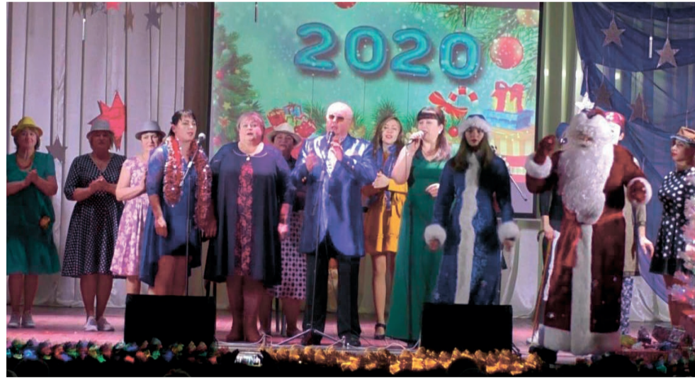
Новорічне свято в Білоцерківці було на висоті.