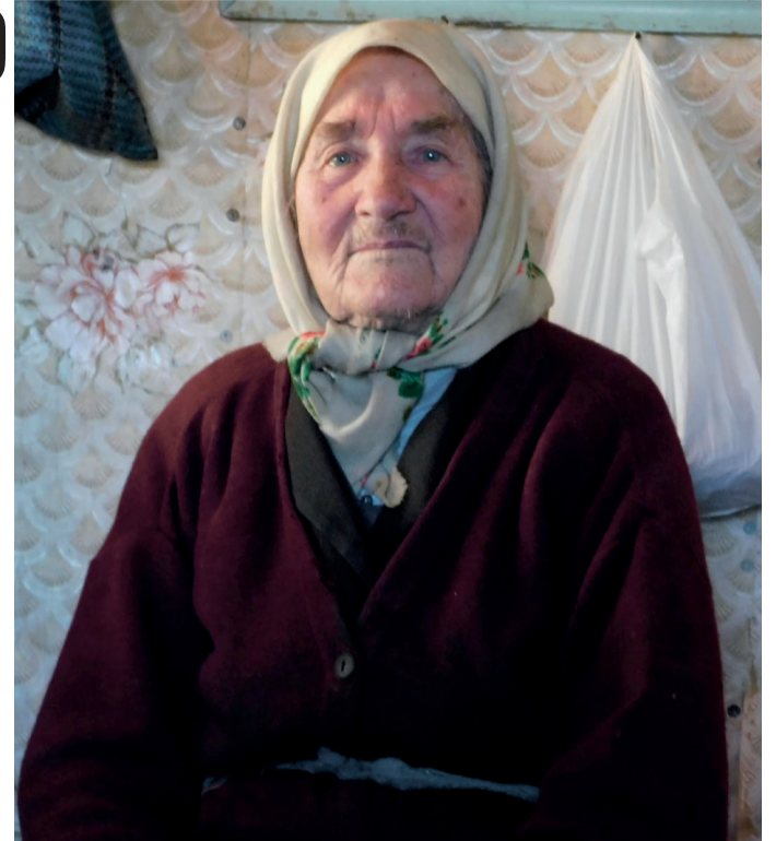
Г. М. Педина.

— Дружно ми жили, не сварилися. І свекруха в мене гар-