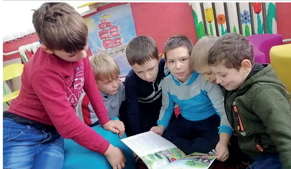
Учні Білоцерківської школи теж долучилися до акції...

Уже протягом 11 років у різних країнах світу відзначають Всесвітній день читання вголос. Учасники акцій, присвячених цьому дню, обирають книжку, знаходять зацікавлену аудиторію і просто читають вголос. Цю ініціативу вже підхопили жителі 173 країн. Цього року Всесвітній день читання вголос припав на 5 лютого.