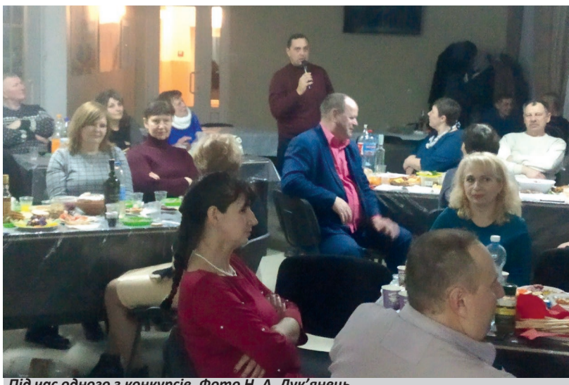
Під час одного з конкурсів.