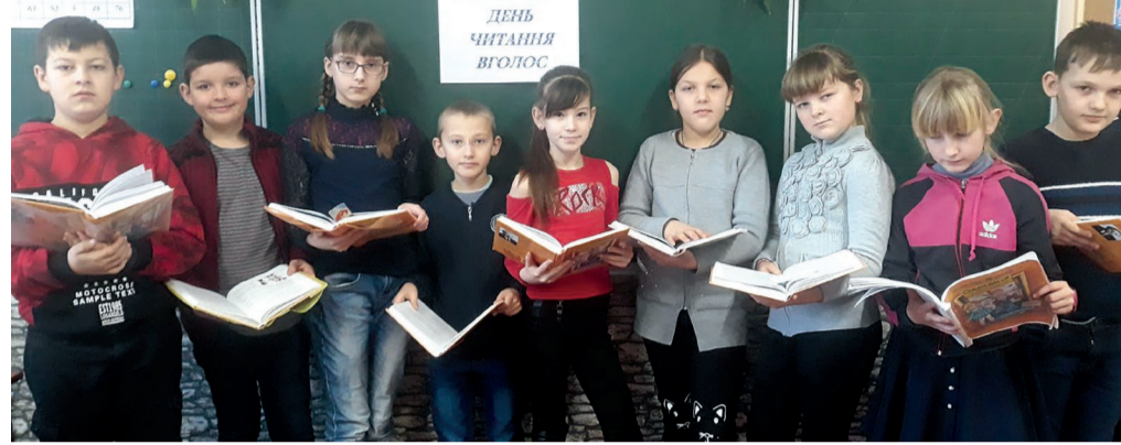
Красногорівські школярі залюбки читають книги.