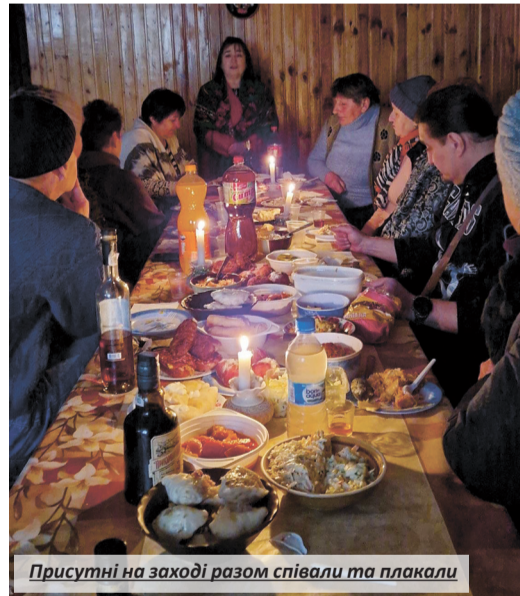
Присутні на заході разом співали та плакали