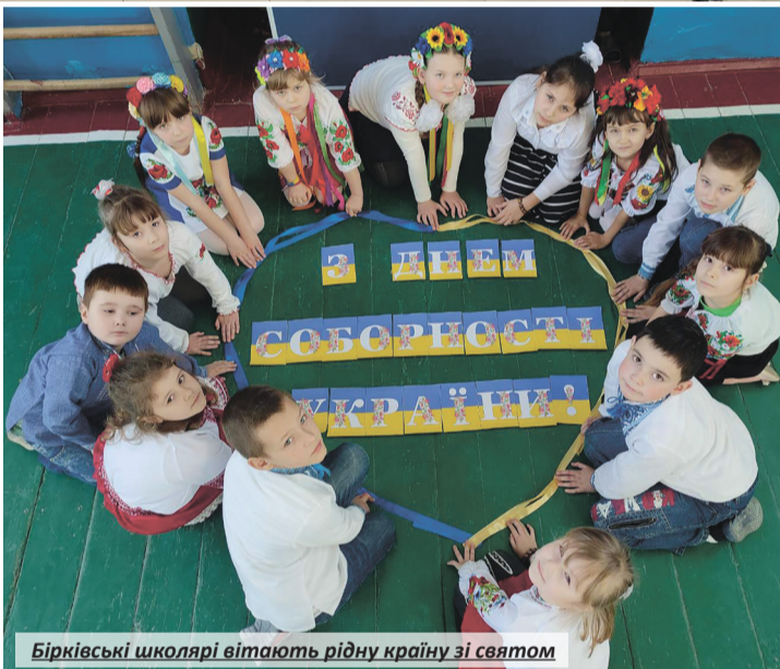
Бірківські школярі вітають рідну країну зі святом