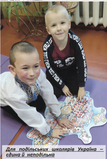
Для подільських школярів Україна – єдина й неподільна