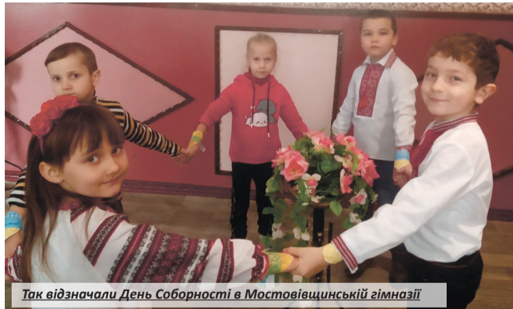
Так відзначали День Соборності в Мостовіщинській гімназії

– це не лише об'єднання в одну державу всіх земель, заселених певною нацією на суцільній території. Це ще й духовна консолідація всіх громадян держави, їхня згуртованість незалежно від національності.