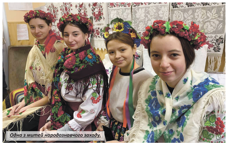
Одна з митей народознавчого заходу.