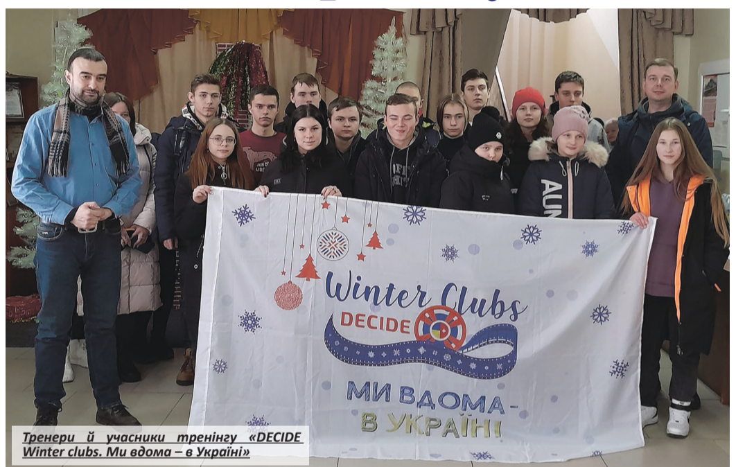
Тренери й учасники тренінгу «DECIDE Winter clubs. Ми вдома – в Україні»

За матеріалами сайту Білоцерківського ліцею.