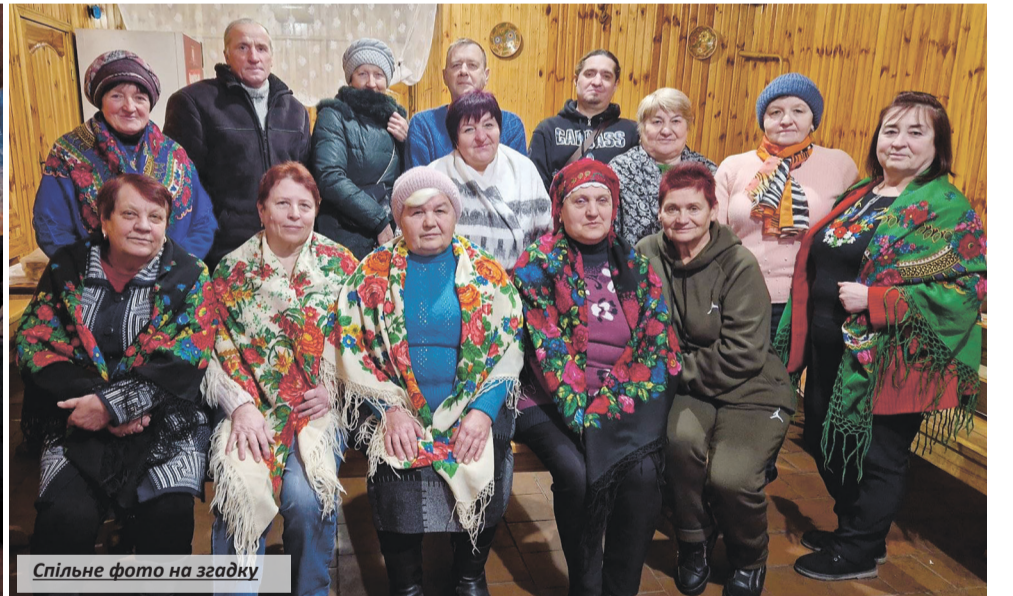
Спільне фото на загалу