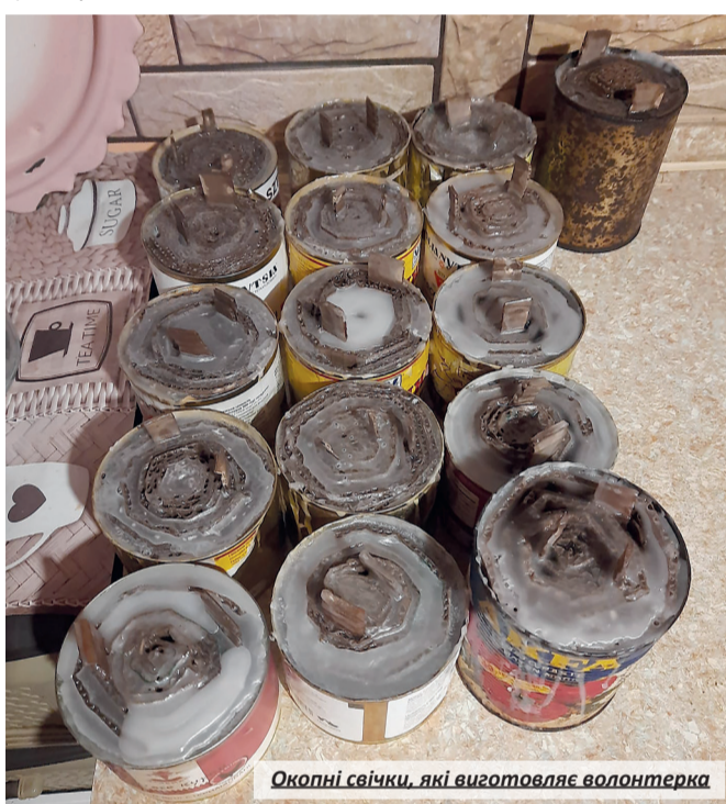
Окопні свічки, які виготовляє волонтерка

— Зараз мені вже не соромно попросити в людей гроші на парафін чи витягти зі смітника консервну бляшанку. Соромно має бути тим, хто рахує зарплату мого вітчима чи інших бійців на передовій, а сам відсиджується тут, у тилу, — говорить дівчина. — Кожен по-різному сприймає війну. Особисто для мене це біль, сльози, туга, розпач, а ще — гордість за наших воїнів. Нерідко я плачу, коли бачу відео чи фото загиблих дітей, жінок, чоловіків... Та потім збираюся з силами і йду робити свічки для хлопців чи вишивати для них обереги. Але без підтримки земляків я б не змогла цього робити.