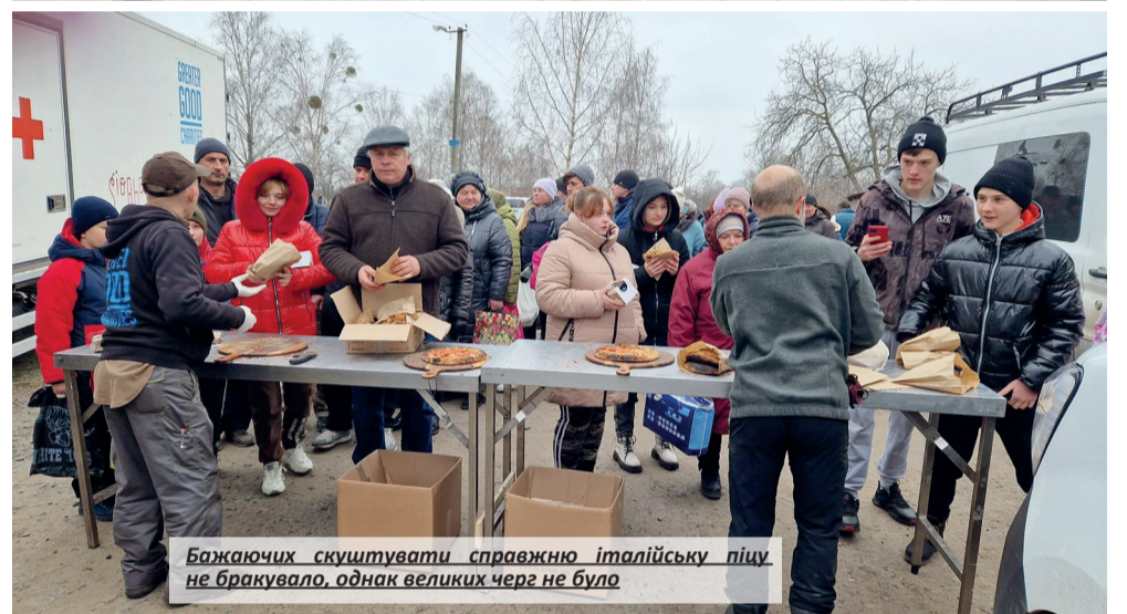
Бажаючих скуштувати справжню італійську піцу не бракувало, однак великих черг не було