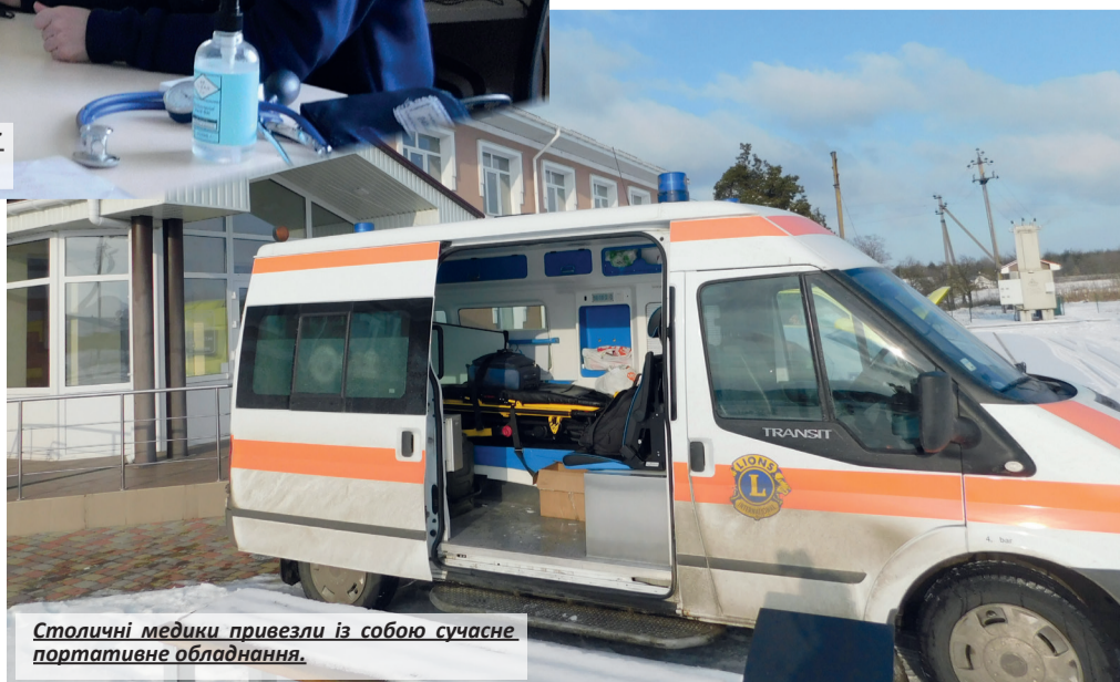
Столичні медики привезли із собою сучасне портативне обладнання.

Виконком Білоцерківської сільської ради та ветеранська організація глибоко сумують з приводу смерті