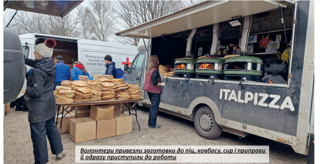
Волонтери привезли заготовки до піц, ковбасу, сир і приправи й одразу приступили до роботи