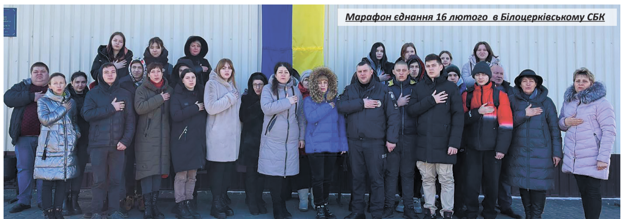
Марафон єднання 16 лютого в Білоцерківському СБК