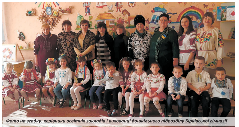
Фото на згадку: керівники освітніх закладів і вихованці дошкільного підрозділу Бірківської гімназії

нювала позитив, а її поради були простими, конкретними й дуже актуальними. Тож користь від тренінгу відзначили всі учасники наради.