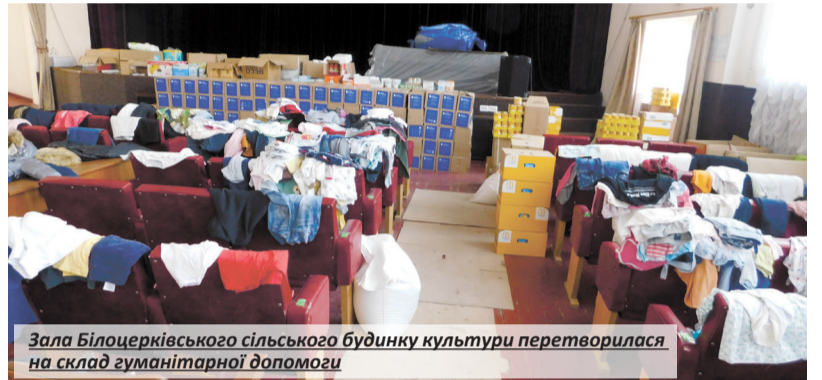
Зала Білоцерківського сільського будинку культури перетворилася на склад гуманітарної допомоги