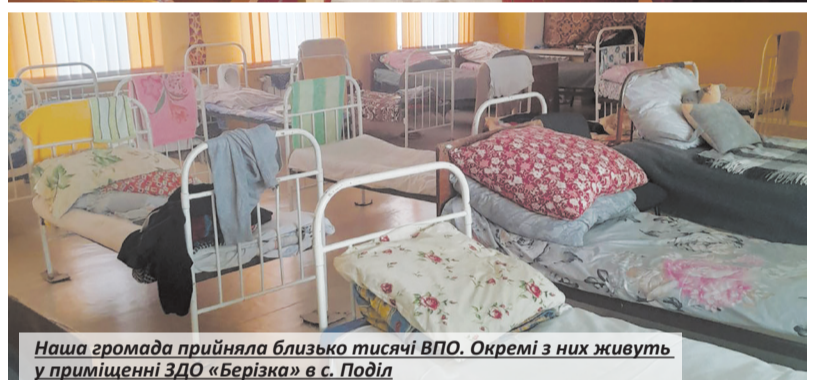
Наша громада прийняла близько тисячі ВПО. Окремі з них живуть у приміщенні ЗСУ «Берізка» в с. Поділ

бійці тероборони, та в перші дні війни патрулювали виключно члени громадського формування.