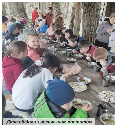
Діти обідали з величезним апетитом