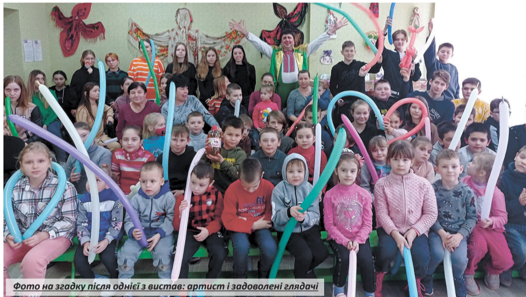
Фото на задку після однієї з вистав: артист і задоволені глядачі