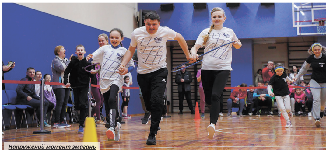
Напружений момент змагань

За звання найспортивнішої сім'ї змагалися 20 родин із 15 громад Полтавщини. Окрім суто спортивних конкурсів «Збий кеглі», «Естафета з обручем», «Набивання тенісного м'ячика за одну хвилину», «Влучання в ціль м'ячем» тощо