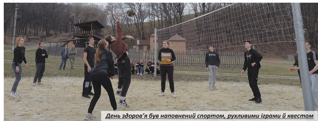
День здоров'я був наповнений спортом, рухливими іграми й квестом

Тим часом кухарі заздалегідь напекли пе-